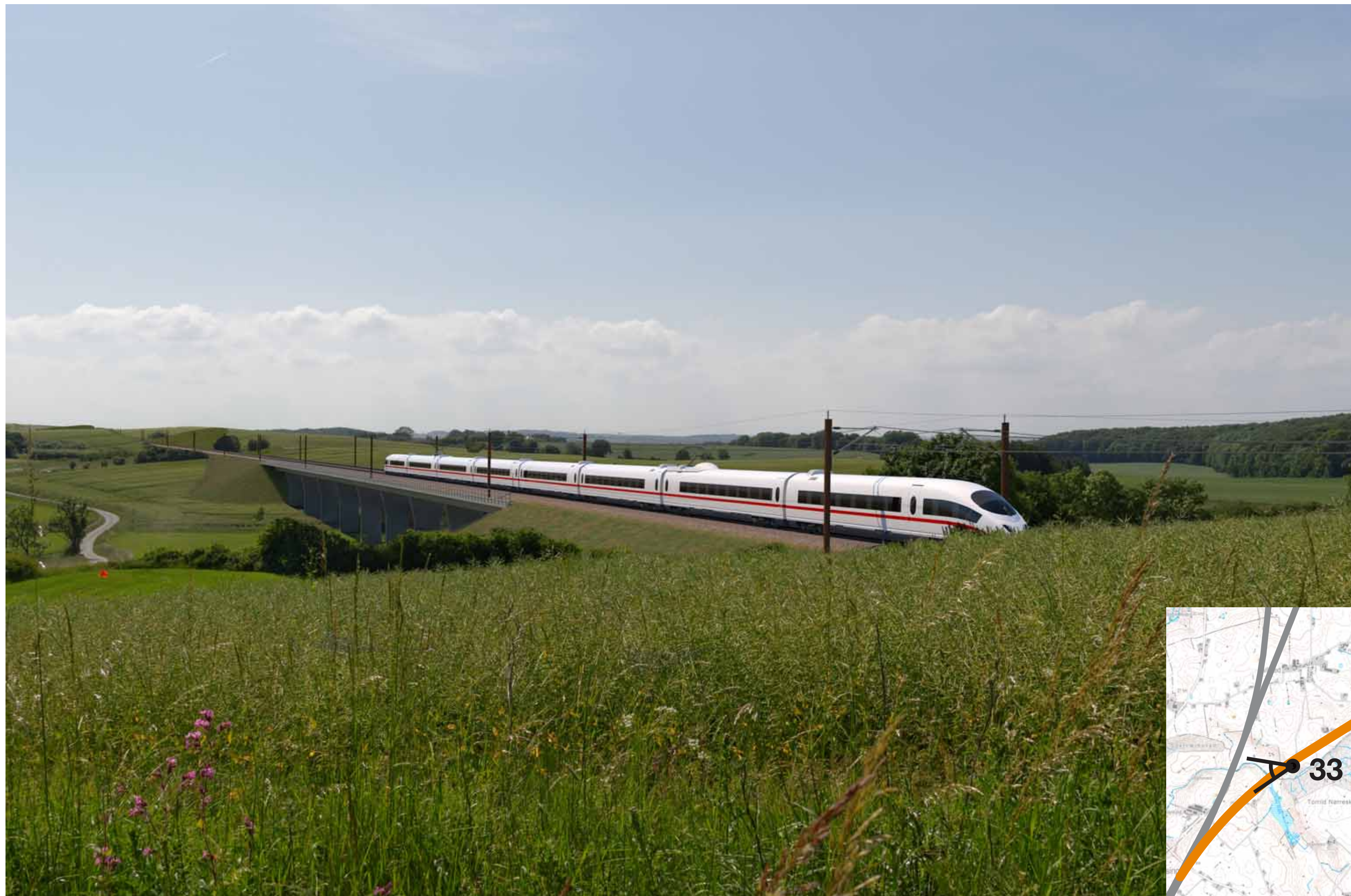
Visualisering af løsning