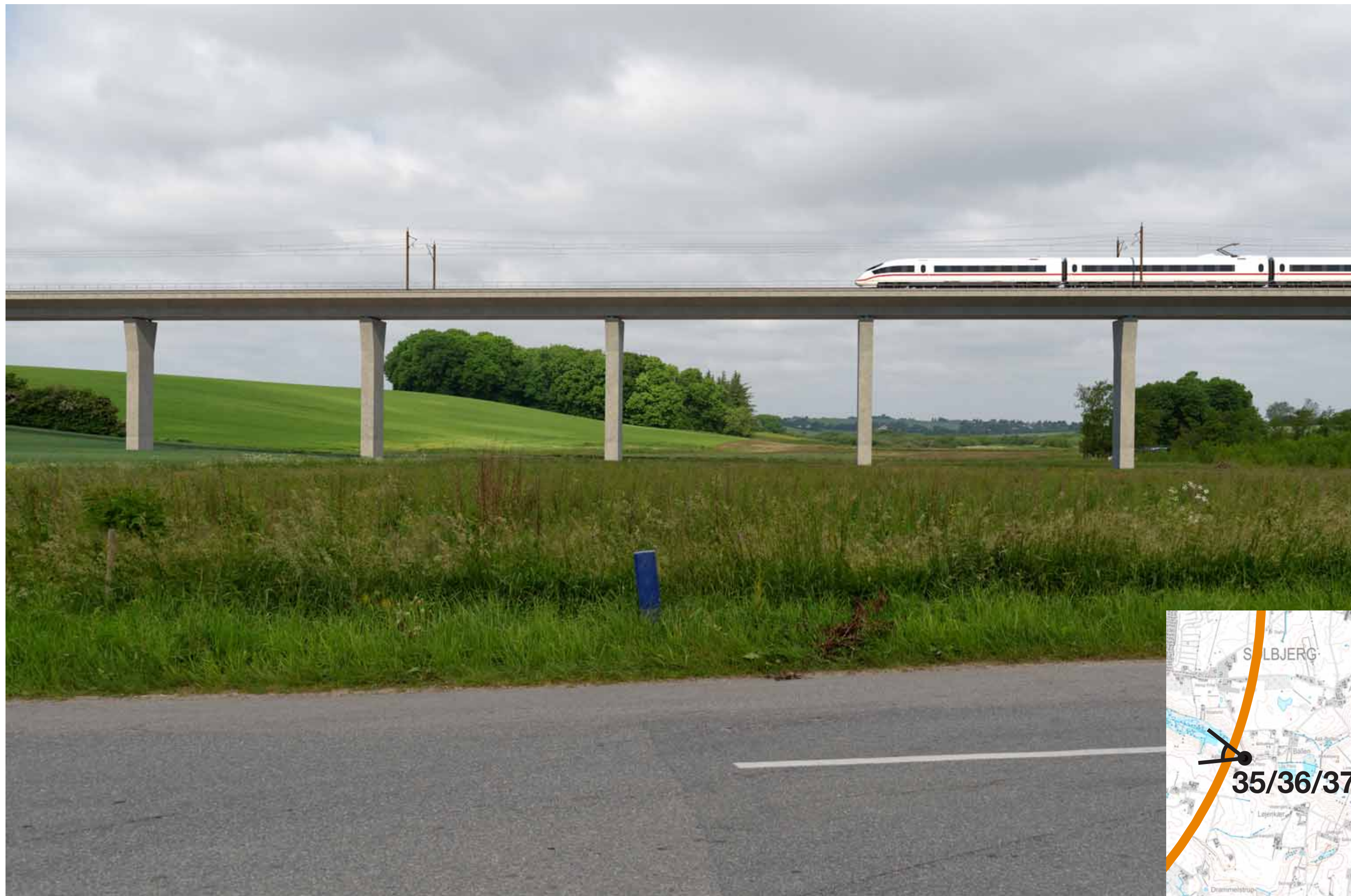
Visualisering af løsning