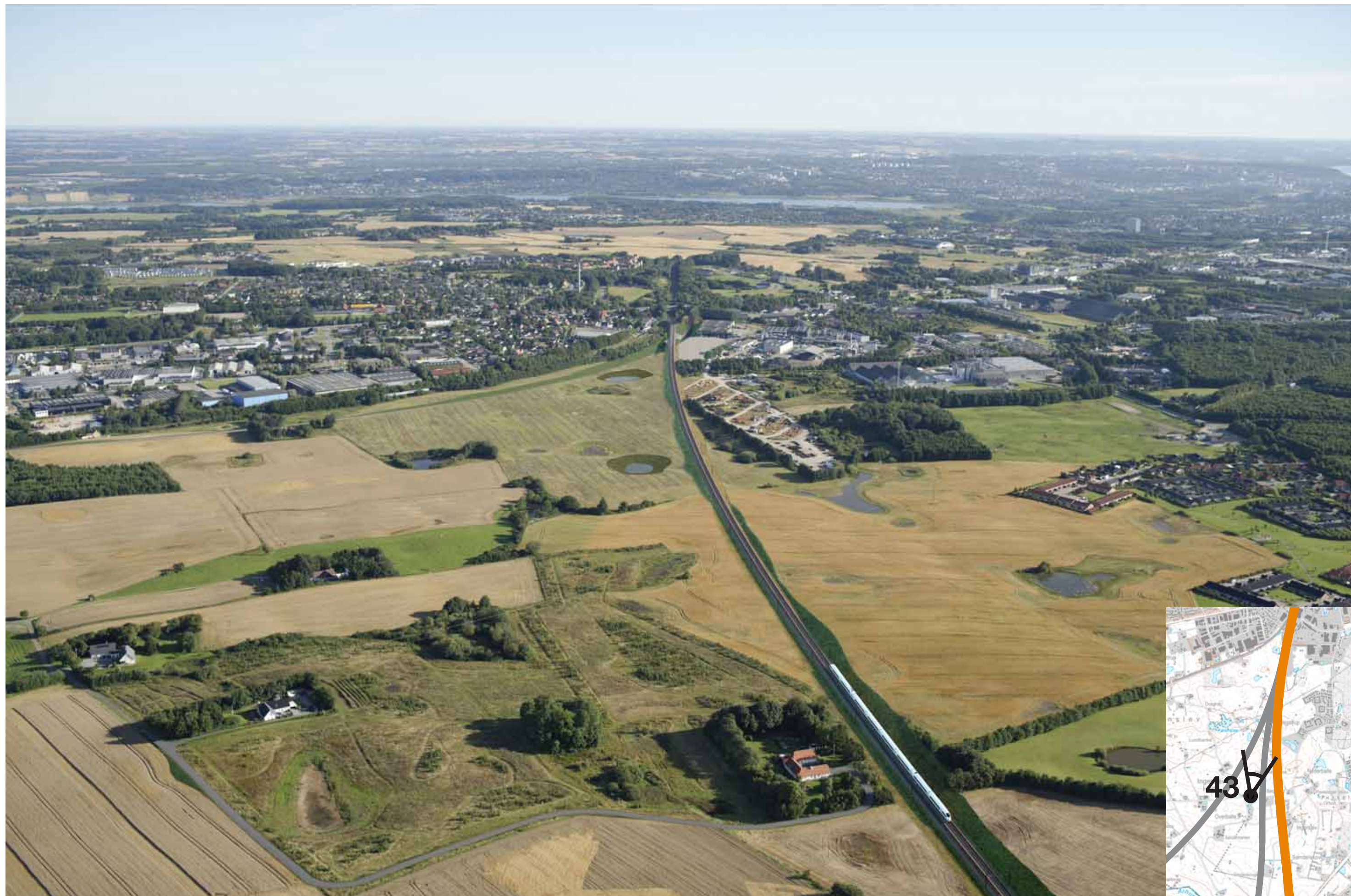
Visualisering af løsning