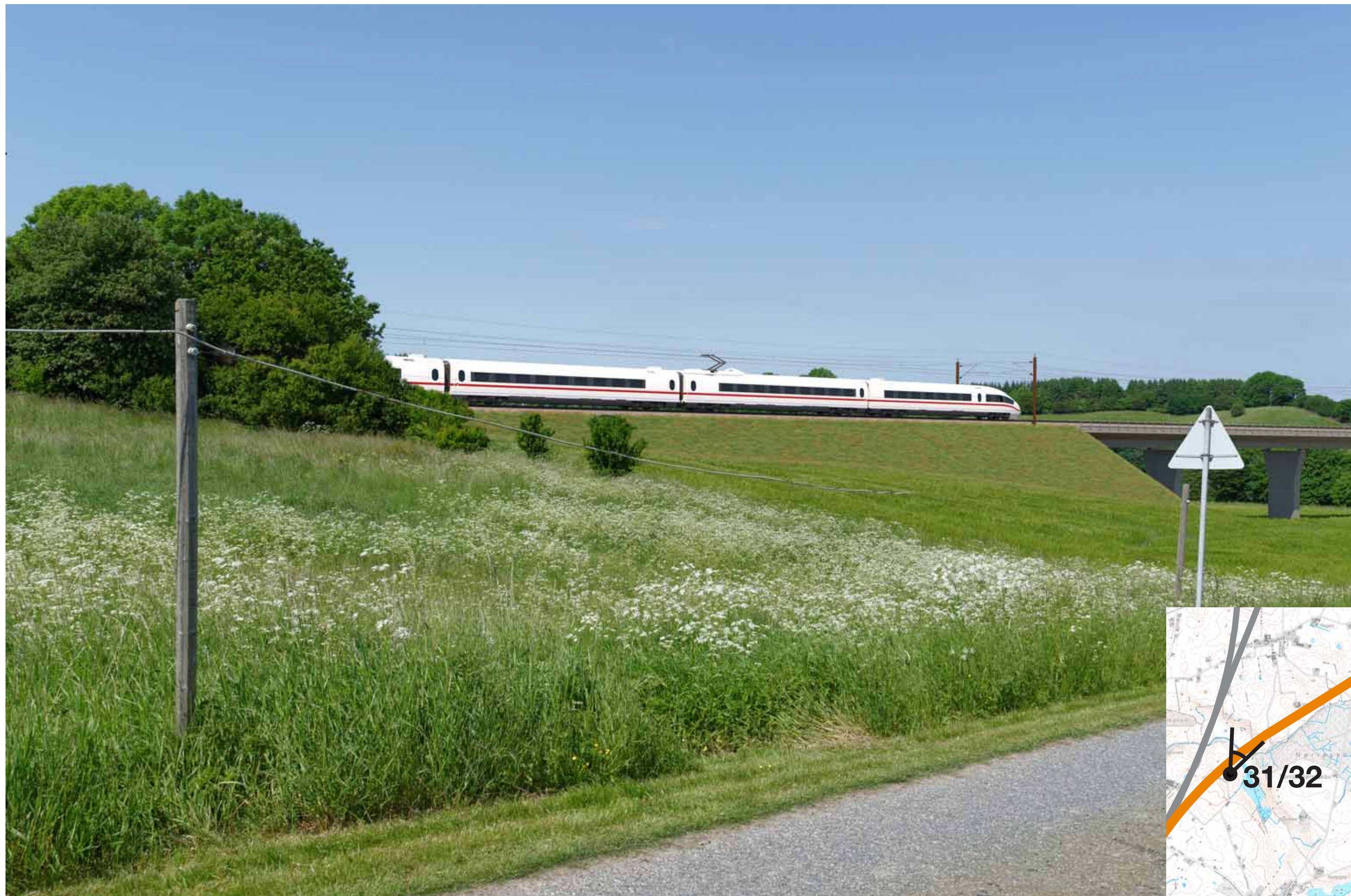
Visualisering af løsning