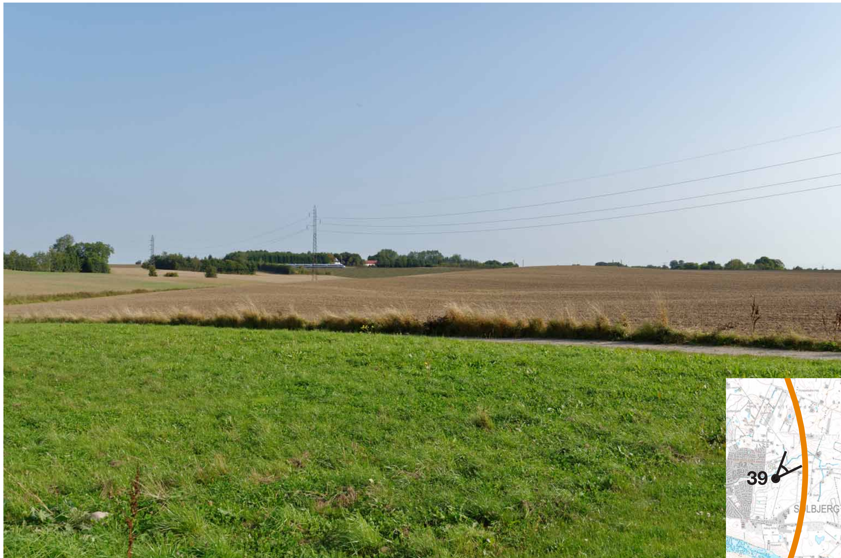
Visualisering af løsning