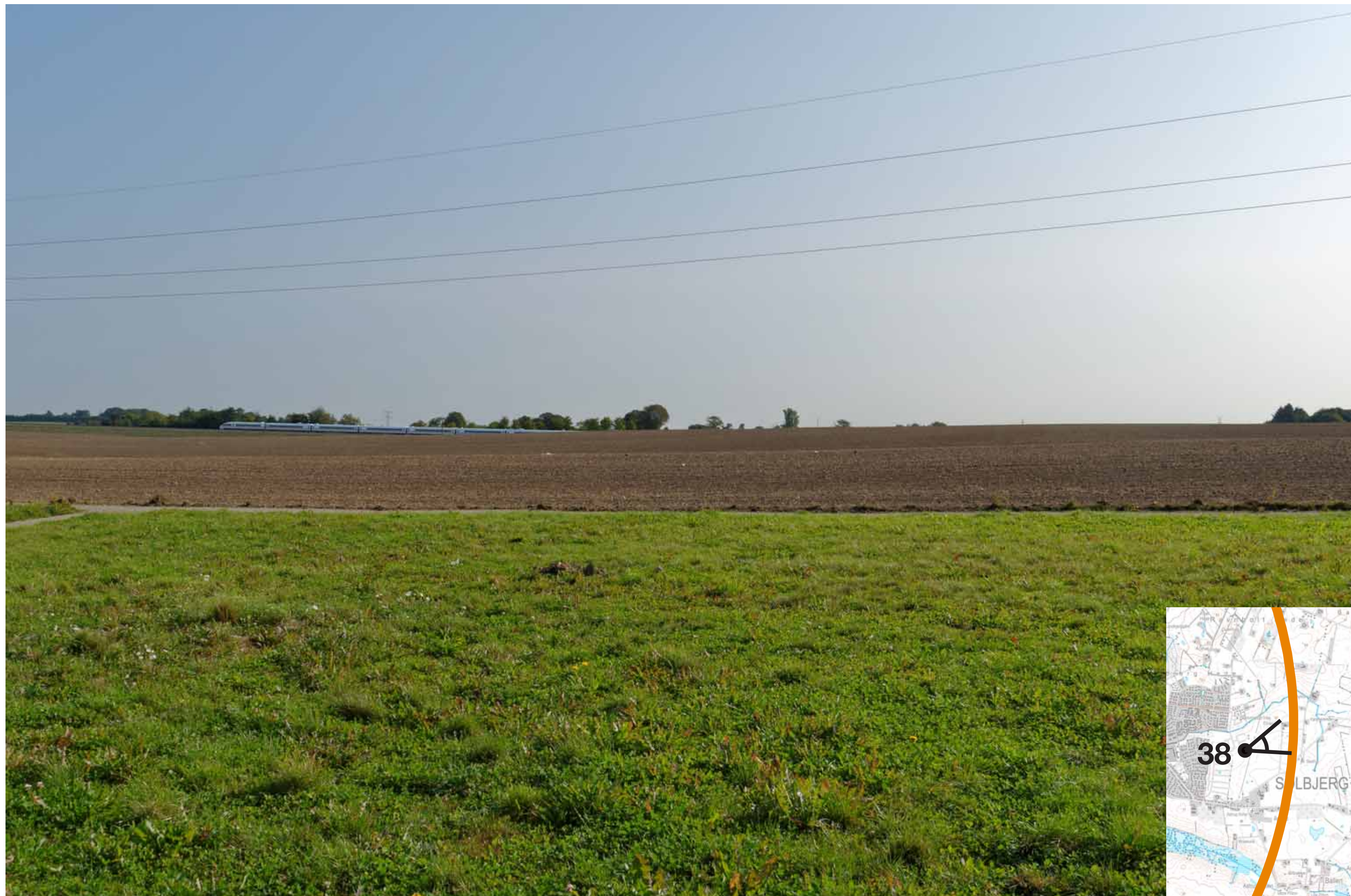
Visualisering af løsning