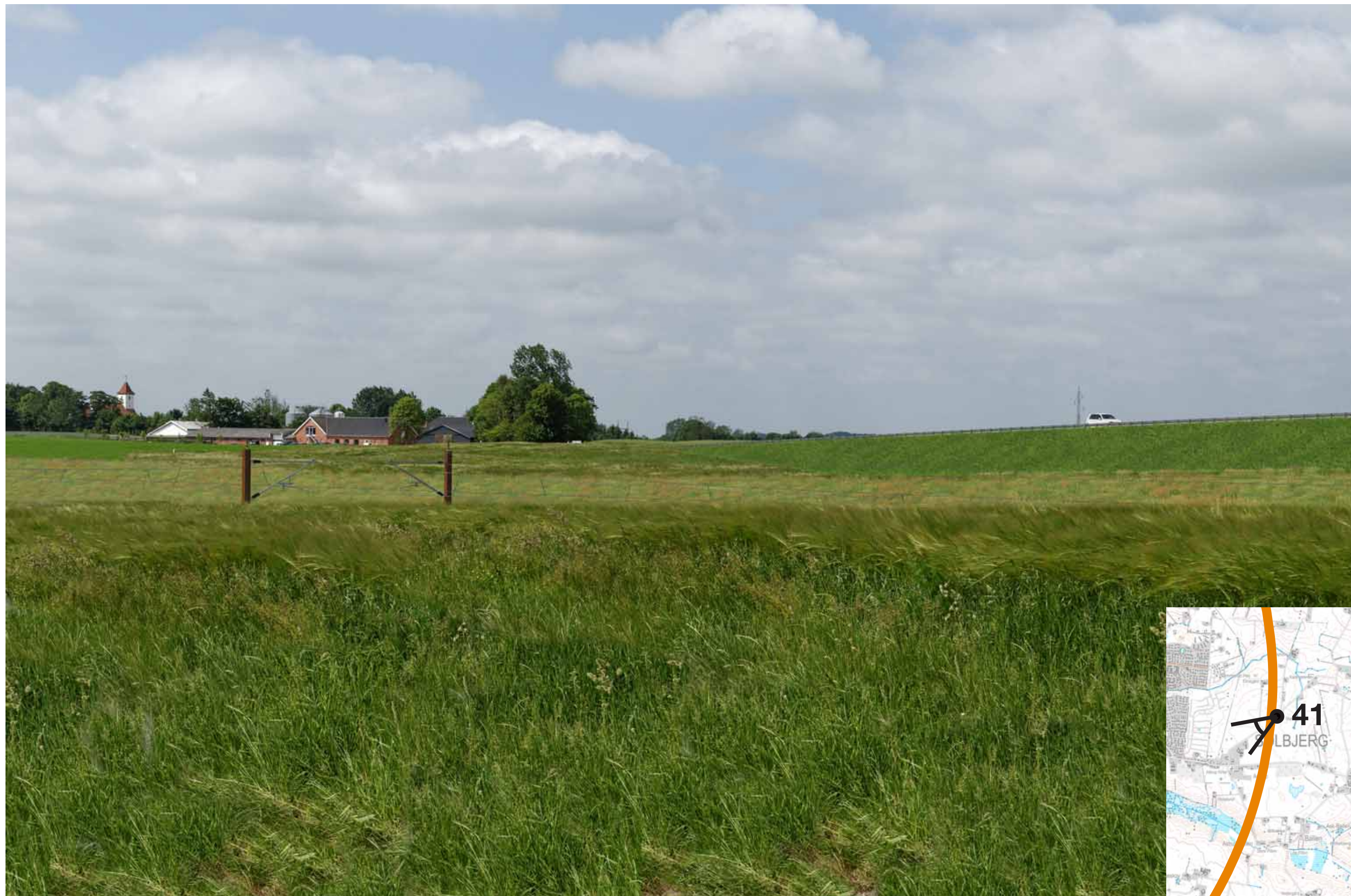
Visualisering af løsning