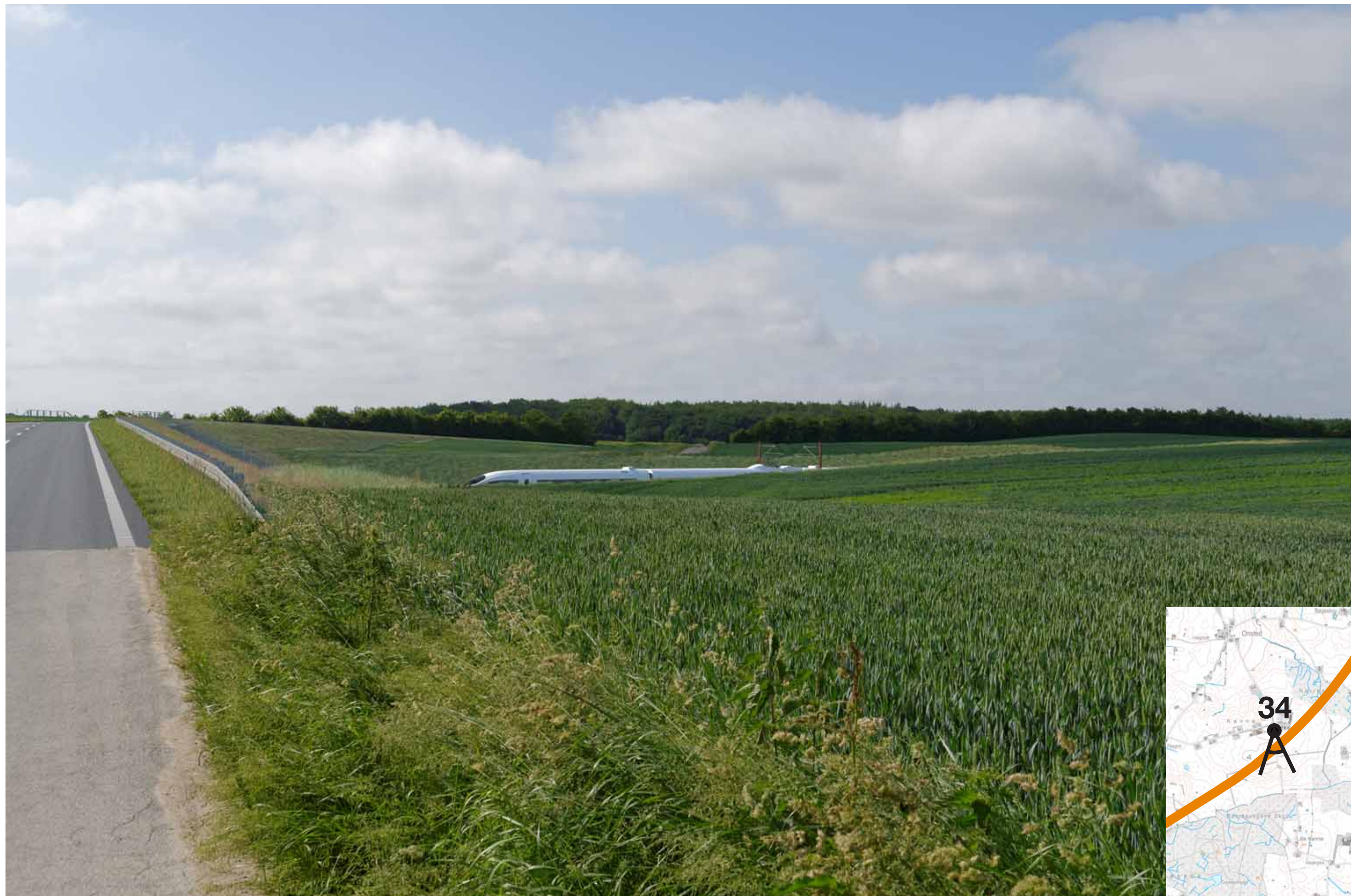
Visualisering af løsning