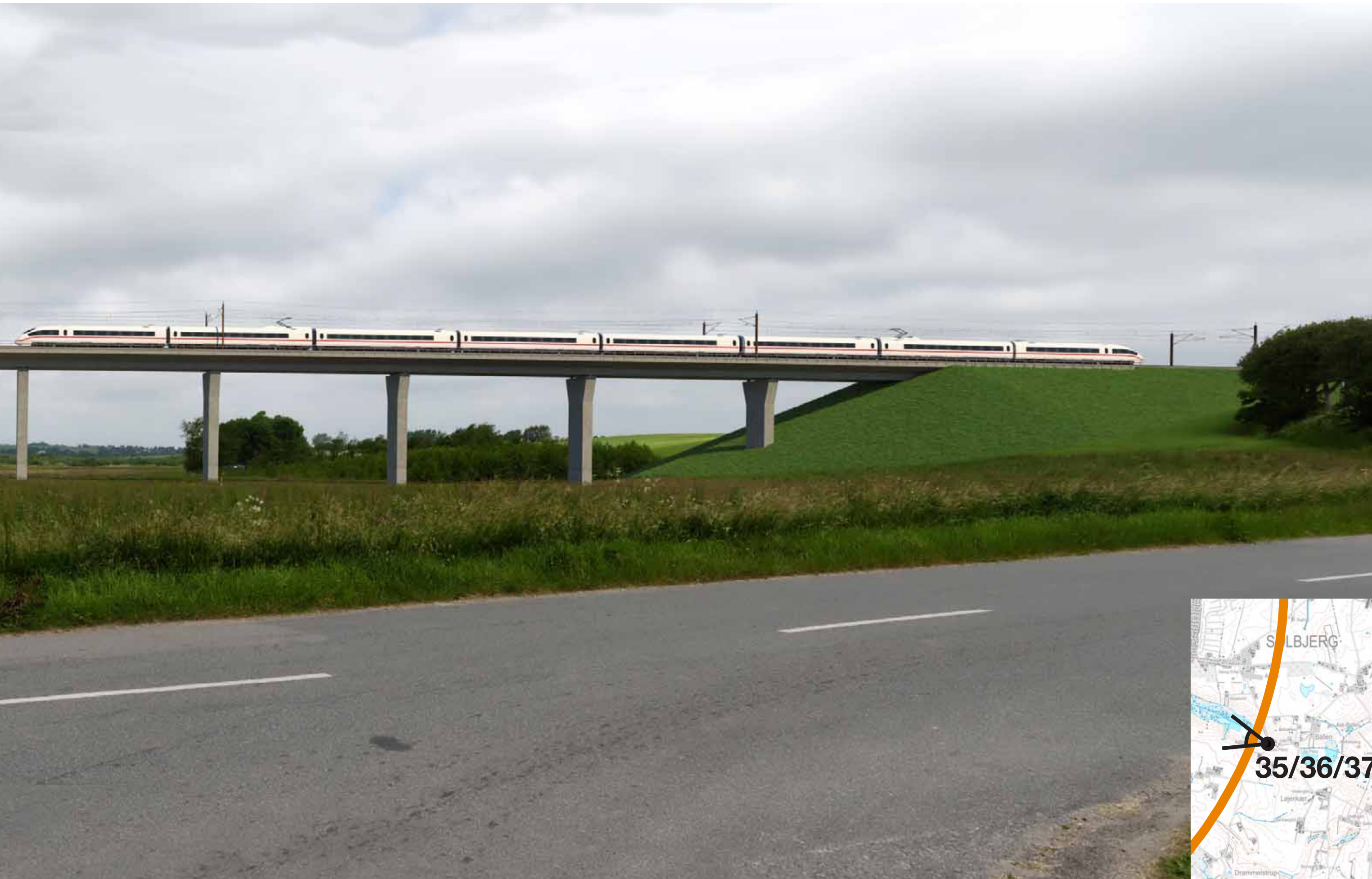
Visualisering af løsning