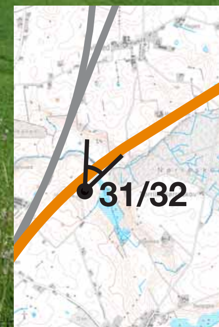
Visualisering af løsning