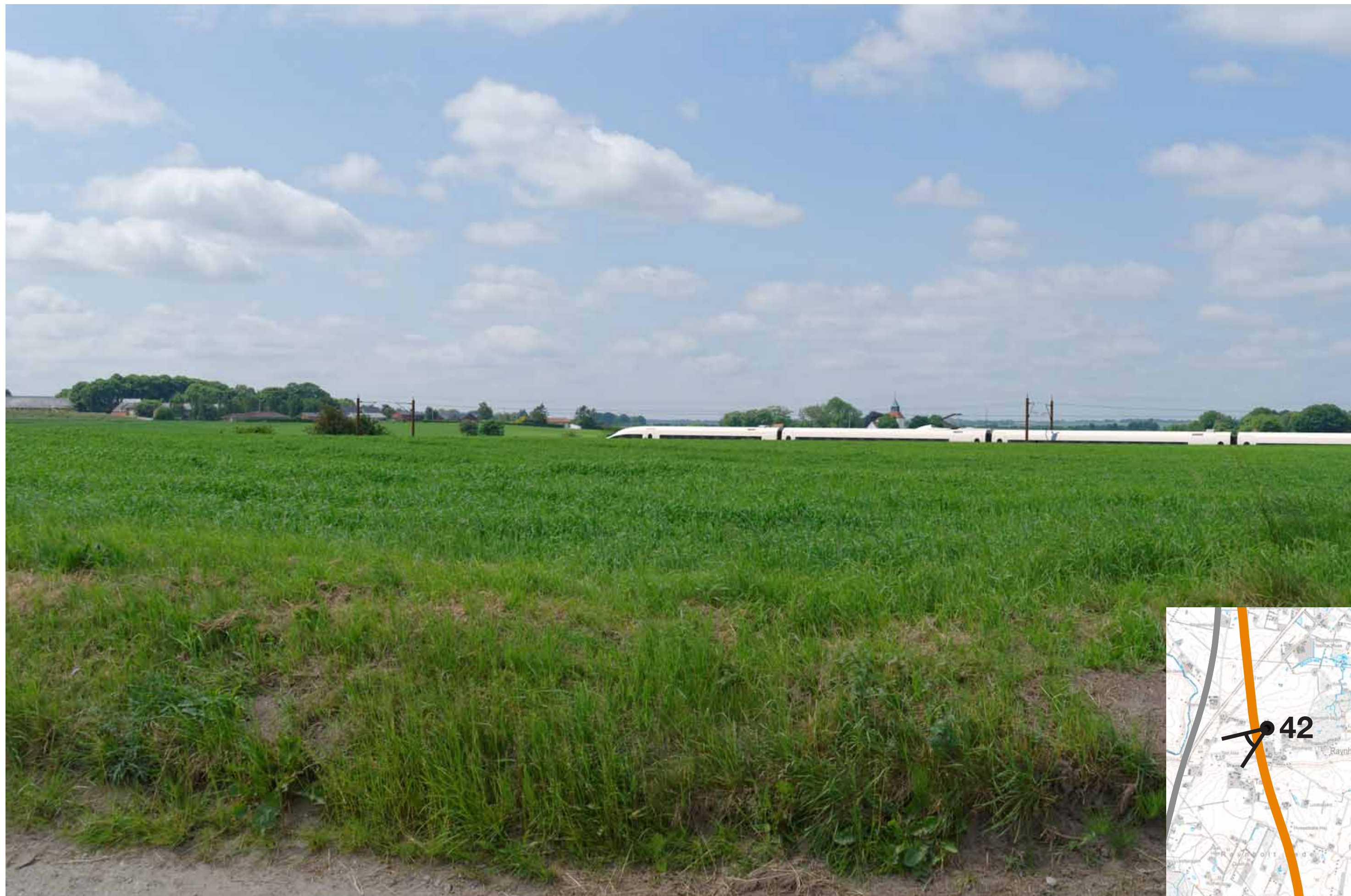
Visualisering af løsning