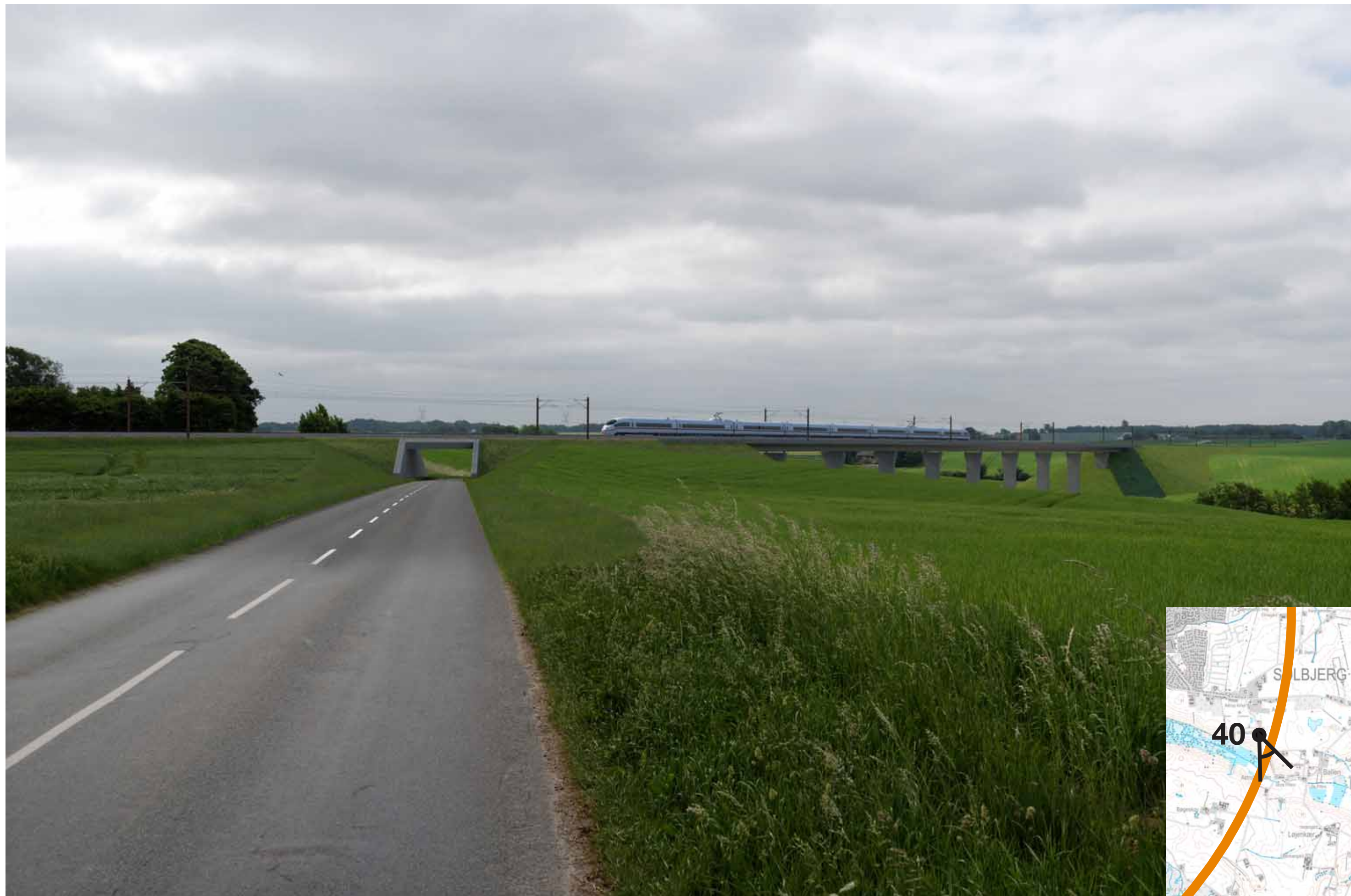
Visualisering af løsning