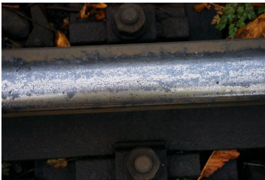
Fotografi af løvfald på skinner. 2

Glatte skinner pga. løvfald er primært et nordeuropæisk og mellemeuropæisk problem. Nedenstående billede viser et eksempel med løvfald på en skinne.