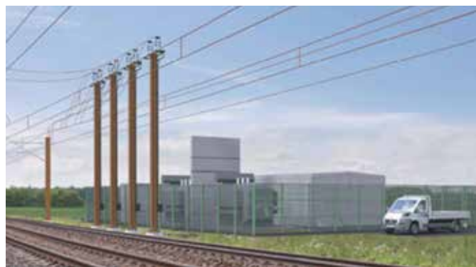
Fig. 4. Visualisering af en fordelingsstation.

Ud over masterne skal der placeres en række bygværker langs strækningen. Vest for Randers samt syd for Svenstrup etableres to fordelingsstationer, som omformer den strøm, der forsyner de eldreve tog.