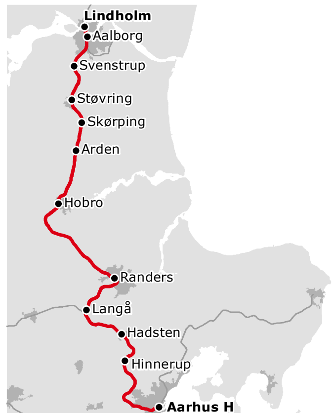
Fig. 1. Jernbanestrækningen Aarhus H - Lindholm.

For at gøre plads til køreledningerne over sporene er det nødvendigt at udskifte eller hæve en række af de broer, der leder vejtrafikken hen over jernbanen. Mange af broerne er bygget i en tid før tanker om elektrificering, og har derfor ikke den fornødne frihøjde mellem jernbanen og broen, så der er plads til køreledningerne.