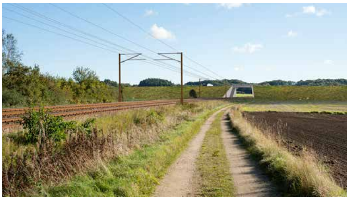
Fig. 8. Visualisering af eksempel på en ny vejbro over banen.

I driftsfasen vil jernbanestrækningen være elektrificeret. Det betyder, at lokal udledning af forurening fra dieselmateriel erstattes af et forbrug af strøm. I det omfang der ikke anvendes vedvarende energi, vil udledningen derfor komme fra kraftværker, der ligger andre steder. Beregninger viser, at der sker et fald i udledningen af luftforurenende stoffer med ca. 50-75 pct. ved overgangen til elektrificering på strækningen Aarhus H – Lindholm. Udledningen af drivhusgassen CO 2 falder med ca. 40 procent på hele strækningen fra Aarhus H til Lindholm. Beregningen skal dog tages med forbehold, bl.a. fordi der ikke er kompenseret for CO 2 -kvotesystemet, og fordi der ikke er indregnet effekten af, at der flyttes passagertransport fra bil til tog, hvis togenes hastighed og kapacitet opgraderes. Medtages disse effekter, vurderes det, at CO 2 -udledningen kan falde yderligere.