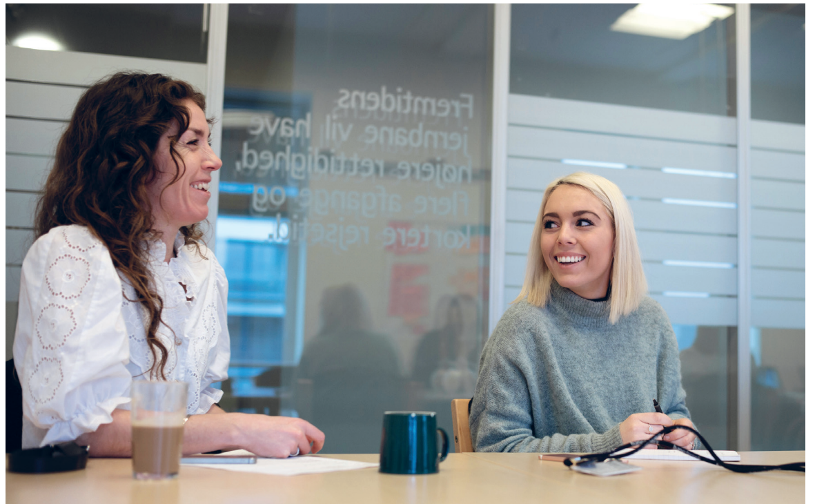
E-LEARNING. Onsdag er der møde om et nyt e-learning-kursus om journaliseringspligten, som bliver obligatorisk for alle medarbejdere i Banedanmark.