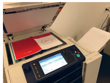
UGE 1. Kopiering er også en del af hverdagen i HR.