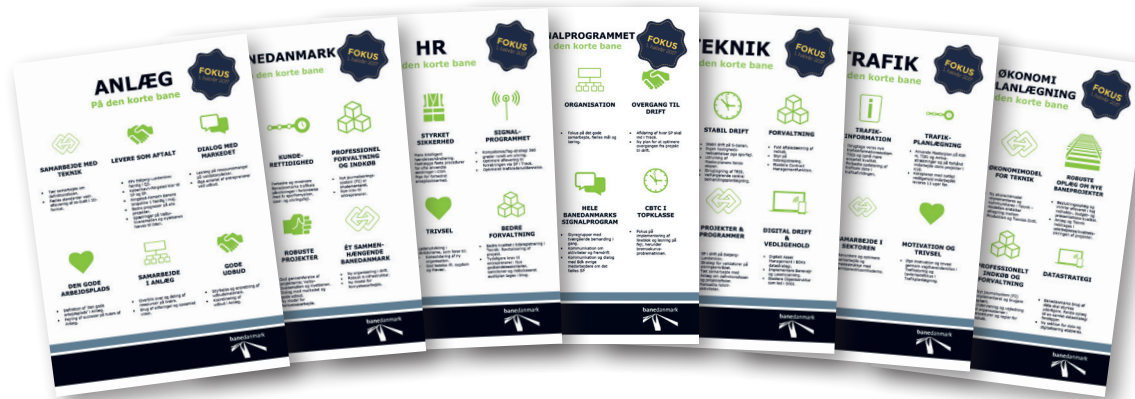
PÅ DEN KORTE BANE. Der er udarbejdet ny plakater, der opsummerer de vigtigste områder, der skal arbejdes med i første halvår af 2017. Illustration: Banedanmark

Inden vi tager et kig på 2017, dvæler vi lige et kort øjeblik ved det år, der er gået. "Når vi kigger på Banedanmarks på den korte bane-plakat for 2016, så er vi faktisk nået i mål med det meste. Der er sket rigtig meget i 2016, og vi har haft vores udfordringer, der desværre overskygger