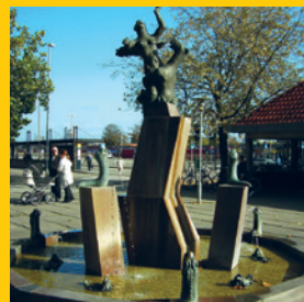
KUNST PÅ STATIONEN. Hvem har skabt kunstværket "Kattekvinden og hestemanden" på Køge Station?

Kender du svaret, eller kan du finde frem til det, så send det til konkurrence@bane.dk. Vi skal have dit svar senest torsdag den 5. oktober.