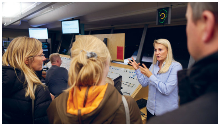
TRAFIKSTYRING. Kultur natgæsterne får på kort tid indblik i vores komplekse verden.

se en virtuel rejse, som skildrer den samlede rejse med tog. Derudover har vi et stort kort, som dykker ned i projekterne, og et Thomas Tog-