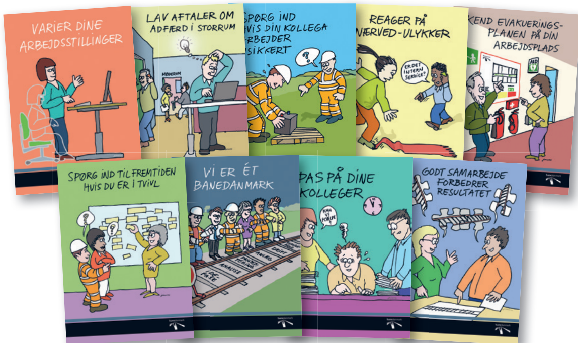
PLAKATER. Arbejdsmiljødagen bliver også markeret med en række plakater, der kommer op rundt omkring i organisationen. Illustration: Jens Voxstrup

Du kan dele dine billeder fra Arbejdsmiljødagen på Instagram mærket med #arbejdsmiljødag og #mitbanedanmark. Så kan det være, de kommer i baneavisen næste gang.