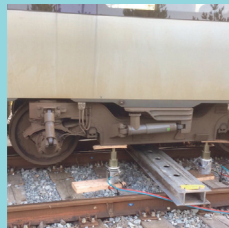
aksel118 Når vejret er godt vil jeg gerne se mine gode folk arbejde 😊 Selv på en søndag 🙌 #hjælpevognsberedskabet #mitbanedanmark #vildtmegetatsetilde2sidsteuger 🙌🙌🙌

Tag et billede fra din arbejdsdag, sæt #mitbanedanmark på – så kan det være, at det kommer på bagsiden af baneavisen næste gang. Følg også Banedanmark på Facebook, Twitter, LinkedIn og YouTube.