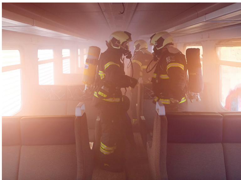
I RØG OG DAMP. Medarbejderne fra Beredskab Øst havde blandt andet til opgave at komme ind i toget ved egen hjælp og redde passagererne ud.

"En øvelse som den her, hvor kollegerne kan komme ud og prøve sig selv af i noget, der minder om virkeligheden, er med til at gøre os skarpere på de elementer, der er særegne for jernbanen. Den slags kan vi ikke øve hjemme på stationen, så vi er godt tilfredse med samarbejdet," siger han.