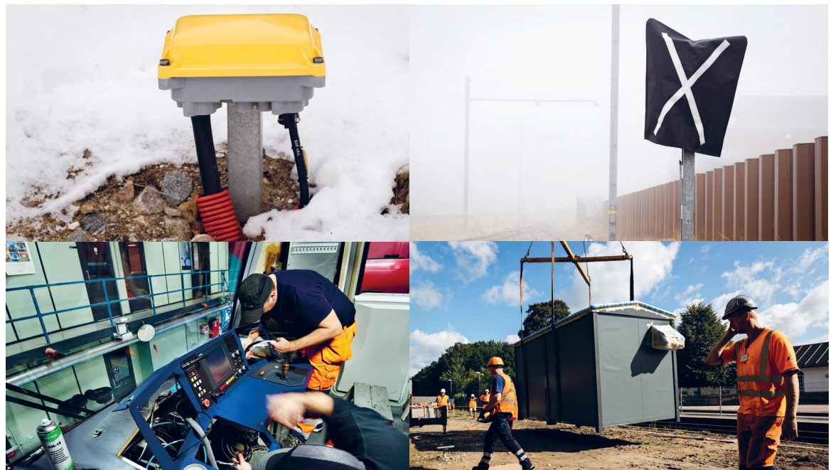
STOR OPGAVER. Det er komplekst at gennemføre Signalprogrammet samtidig med, at der skal køre tog og jernbanen skal fornyes og vedligeholdes.

Hvad er så de næste skridt? Signalprogrammet og Banedanmarks direktion skal nu udarbejde et