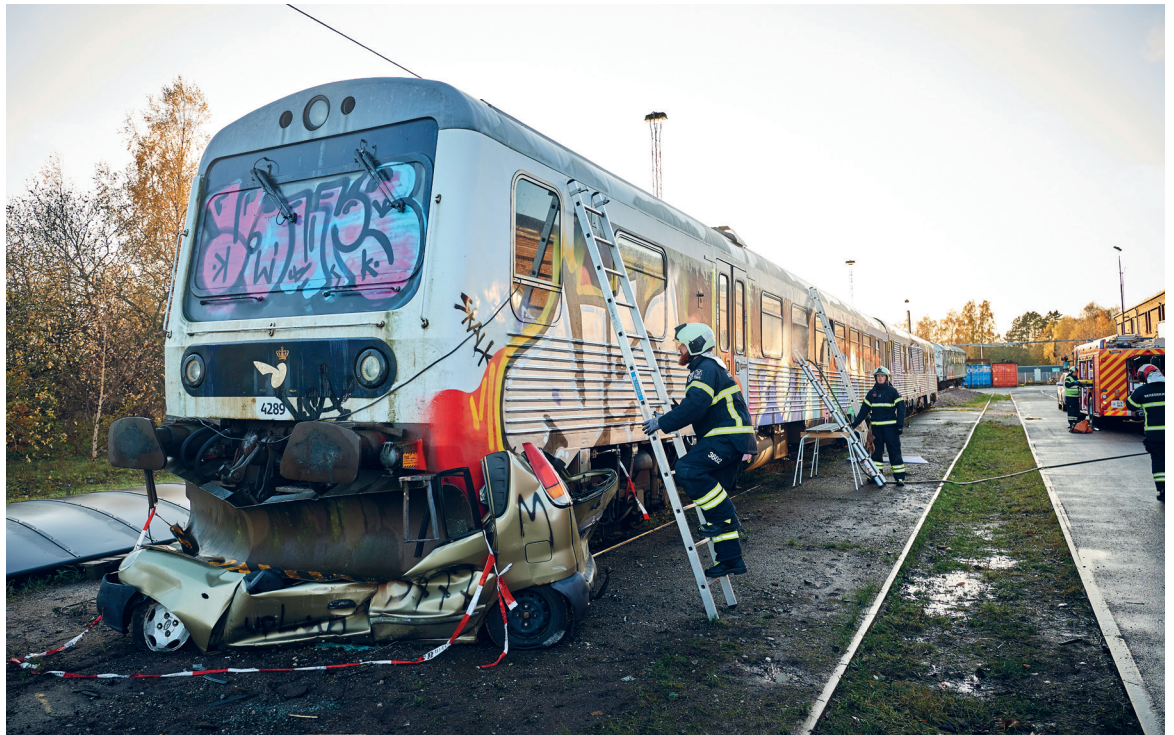
KVAST HYUNDAI. Setuppet til øvelsen var en påkørsel i en overkørsel.

"Beredskabet er ofte de første, der ankommer til et ulykkessted, og der er stor forskel på, om det er jernbanen eller eksempelvis en motorvej. Det er ikke bare et spørgsmål om jording, men også om at sikre sig, at der ikke kører tog i det andet spor, hvis det er en dobbeltsporet strækning. Og så er det vigtigt, at de får tænkt os ind i processen, så vi