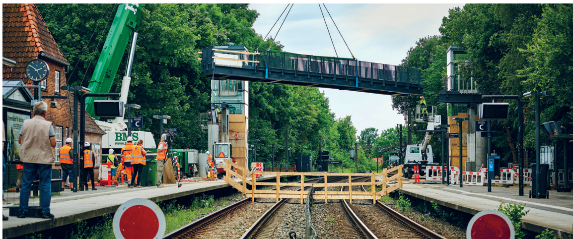
NÅR VI FORSTYRRER. Store jernbaneprojekter kan godt forstyrre både naboer og passagerer. Og det betyder meget, hvordan vi kommunikerer med borgerne i forbindelse med arbejderne, som her på Kystbanen i sommeren 2017.

"Banedanmarks resultater er bemærkelsesværdigt tilfredsstillende" For andet år i træk har Megafon målt på naboernes oplevelse af kommunikationsindsatsen og konkluderer, at Banedanmarks kommunikationsindsats er fuldt på niveau med målsætningen for veldrevne kommercielle virksomheder.