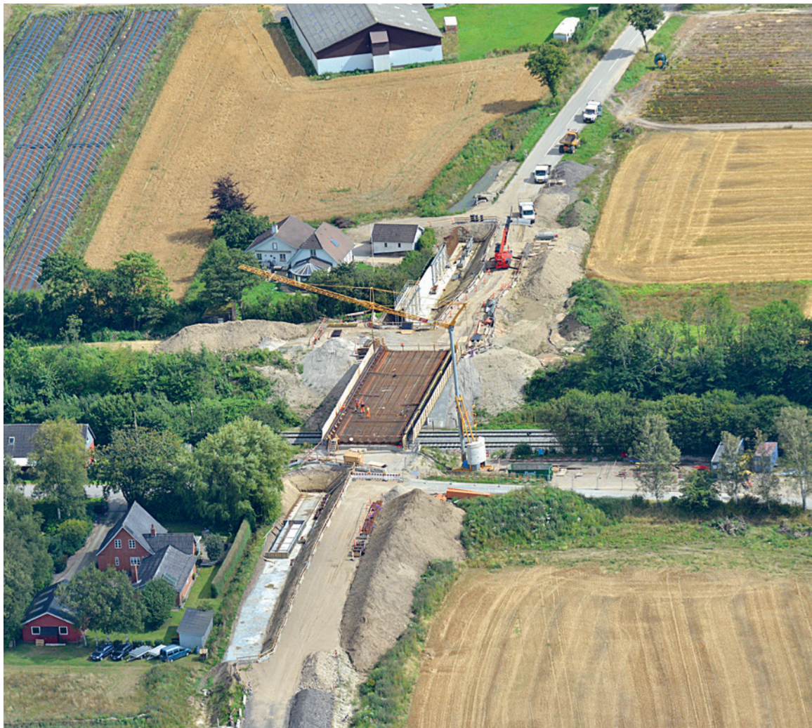
TRAVLHED. Arbejderne på Ringsted-Femern Banen er meget synlige i landskabet. Her er det broarbejder ved Tyvelse mellem Ringsted og Næstved.

Men ikke kun ude i det åbne landskab arbejdes der intensivt. Både i Næstved og Vordingborg bymidte er store maskiner i fuld gang. I Næstved - lige ved stationen - skal der bygges en helt ny vejbro, som forbinder byen og lede vejtrafikken hen over jernbanen.