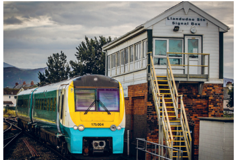
TAG MED TOGET, HVIS DER ER PLADS. Der har været øgede investeringer, og flere tog er kommet på skinnerne i Wales. Det er nu så populært at tage toget, at der klages over, at de er overfyldte.

bud på, at 22.000 hver måned ville benytte linjen i begyndelsen, og at det tal så ville stige til 33.000 i 2012.