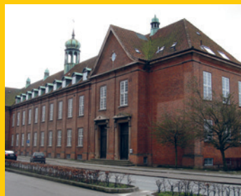
SMUK BYGNING. Godsbanegården i Aarhus er tegnet af Heinrich Wenck. Men hvornår ophørte den med at være godsbanegård?

Godsbanegården blev taget i brug i 1923, men hvornår stoppede den med at fungere som godsbanegård? Det kunne vi godt tænke os at vide. Kender du svaret – eller kan du finde frem til det, så send en mail til konkurrence@bane.dk. Vi skal have dit svar senest torsdag den 3. november.